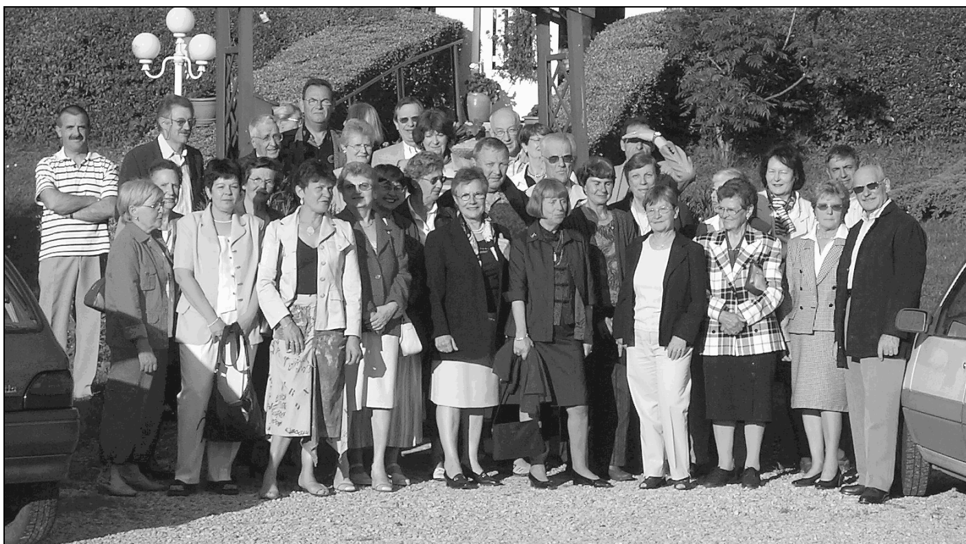
L'équipe des bénévoles et leurs familles ...