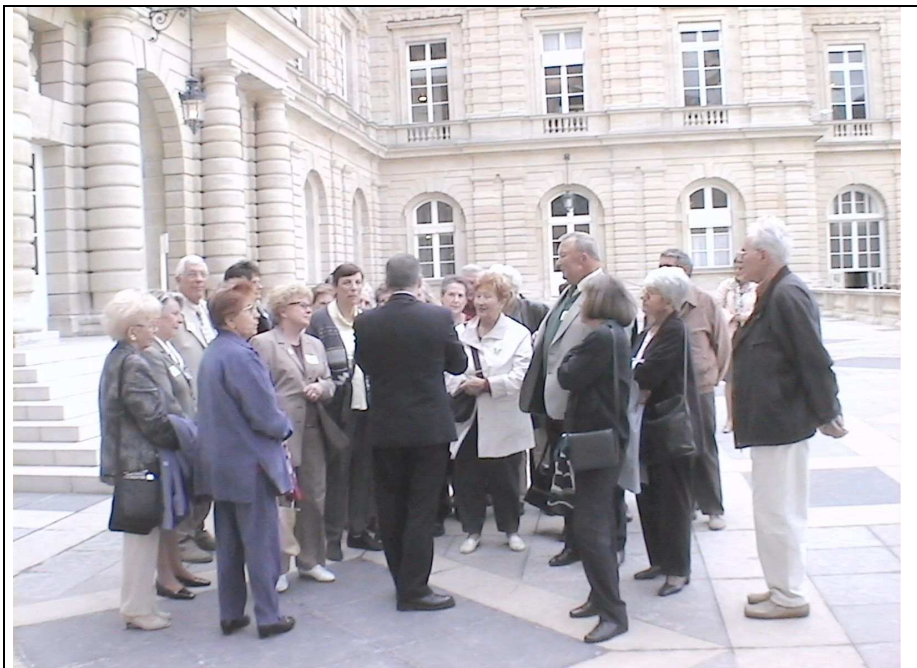
Le groupe de l'AVF dans la cour du Sénat ...